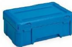
Contenant de 4L

Le contact référent du compte BioLogistic® ou la personne en charge de l'envoi dépose le ou les sacs Diagnobag® dans le contenant de 4 litres apporté par le transporteur BioLogistic®. Il scelle le colis et remet au transporteur le bon de livraison.